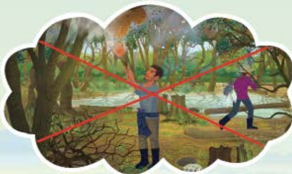
ហាមដុតព្រៃលិចទឹកចាប់សត្វ និងយកឃុំ