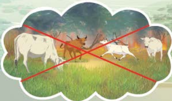
ហាមដុតព្រៃលិចទឹកដើម្បីរកគោក្របី និងហាមដុតព្រៃលិចទឹកដើម្បីឱ្យស្មៅដុះសម្រាប់គោក្របីស៊ី