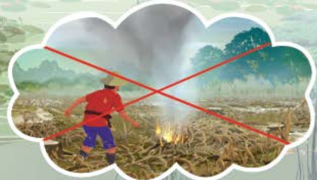
ហាមដុតសម្អាតចម្ការជាប់ព្រៃលិចទឹកដោយគ្មានការអនុញ្ញាត