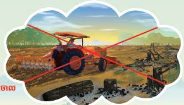
ហាមធ្វើសកម្មភាព និងទន្រ្ទានយកដីព្រៃលិចទឹកដែលឆេះធ្វើជាកម្មសិទ្ធិ