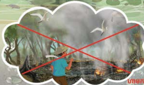
ហាមកាប់ និងដុតព្រៃលិចទឹកធ្វើស្រែ និងចម្ការ