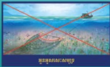
អនុសាសនា-សមុទ្រ