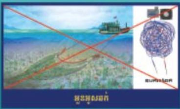
អនុសាសនា