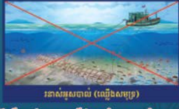
របាស់អុសចាស់ (ឈ្នឹងសមុទ្រ)

ហាមប្រើឧបករណ៍នេសាទទំនើប ឬឧបករណ៍នេសាទដែលបង្កើតឡើង ឬរៀបចំនេសាទឡើង ដែលនាំមកនូវការបំផ្លាញមធ្យមជាតិ និងធនធានជលផល ប្រព័ន្ធណេកូឡូស៊ីជីវផល ឬដែលគ្មានតំណែងក្នុងប្រកាសរដ្ឋប្រតិបត្តិស្វែងរកសិកម្ម ក្រាប្រមាញ់ និងនេសាទ