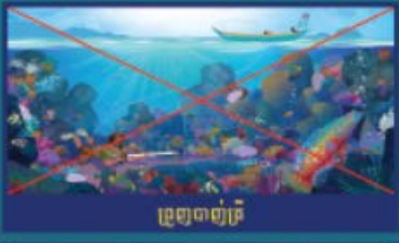
ប្រេងចាញ់គ្រី