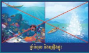
ផ្ទាំងបំបែក និងគ្រឿងផ្គុំ