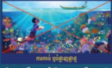
ការកាប់ ឬបំផ្លាញផ្កាផ្កា